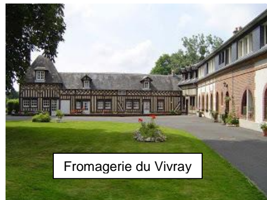
Fromagerie du Vivray

La fromagerie vend la totalité de sa production à des boutiques fromagères de haut de gamme situées dans toutes les grandes villes françaises.